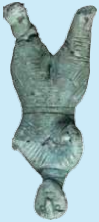
Bronzetto di pugile, V-IV sec. a.C.