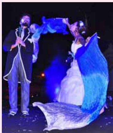
Spettacolo street art

L'arte della clownerie, il divertimento della magia comica e delle grandi illusioni, lo stupore delle bolle di sapone giganti e l'abilità dell'uomo che entra nel pallone, il tutto al ritmo di una colonna sonora di allegra musica classica, sono gli ingredienti speciali di uno spettacolo che lascerà tutti a bocca aperta!