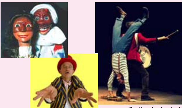
Spettacolo street art

Comp. Iride, F.lli Sam e Mago Barnaba (TN) 26 luglio Nago Torbole - Piazzola ore 21.00 (in caso di pioggia: Teatro Casa della Comunità)