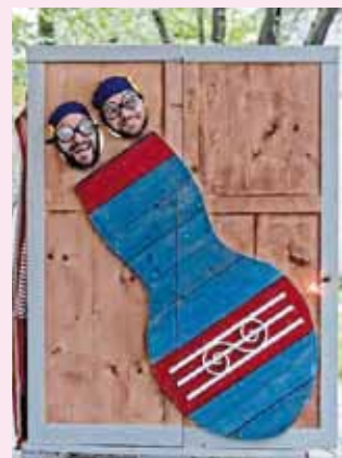
Spettacolo street art

Comp. Samovar (MI) 25 luglio Riva d/G - Rione 2 giugno P.zza Mimosa ore 21.00 (in caso di pioggia: portico Mimosa)