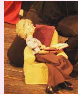
Spettacolo di marionette