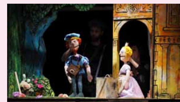
Spettacolo attore e figure

Comp. Teatro delle Quisquille (TN) 9 agosto Riva d/Garda - Cortile Rocca ore 21.00 (in caso di pioggia: Auditorium Conservatorio di Riva d/G - Via Guglielmo Marconi, 5 - entrata libera fino a esaurimento posti)