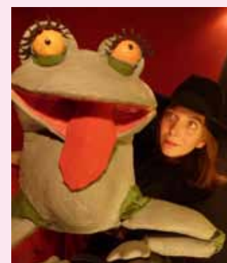
Spettacolo attore, pupazzi e burattini

Comp. Le Rane Verderame (TN) 8 agosto Arco S. Giorgio Parco giochi ore 21.00 (in caso di pioggia: sala del Circolo San Giorgio)