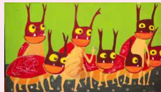
Spettacolo di narrazione con figure

Comp. Iride (TN) 5 agosto Riva d/Garda S. Alessandro-Centro Sportivo ore 21.00 6 agosto Arco Parco Braile ore 18.30 (in caso di pioggia: palestra scuola el. S.Alessandro e Tettoia Braile)